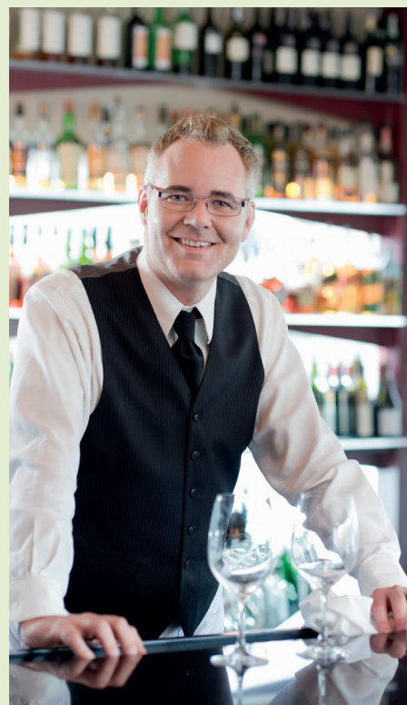
Fíor 3: Próifíl ghairme do Thomás, Bainisteoir Beár

Chuidigh mé leis an Bhainisteoir Beár leis an stoc, ag reáchtáil na mbeár uilig agus ag déanamh uainchláir foirme. Bhí mé an-tógtha nuair a tairgeadh an post mar Bhainisteoir Beár Ócáidí dom. Tá an-ráchairt ar an óstán le haghaidh mórán ócáidí éagsúla lena n-áirítear bainiseacha. Bhí mé freagrach as stoc agus seachadtaí, réamhaisnéis pá agus uainchláir a tháirgeadh. Bhí mé mar bhainisteoir ar fhoireann ócáideach de 15. Ceapadh ar na mallaibh mé mar Bhainisteoir Beár, tá mé anois i mbun foireann lánaimseartha de 6 agus foireann ócáideach de 18. Déanaim sealanna mar Bhainisteoir ar Dualgas san óstán agus tugaim cuidiú do ranna éagsúla de réir mar is gá.