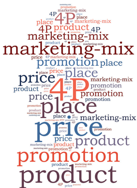
Fíor 1: An Cumasc Margaíochta